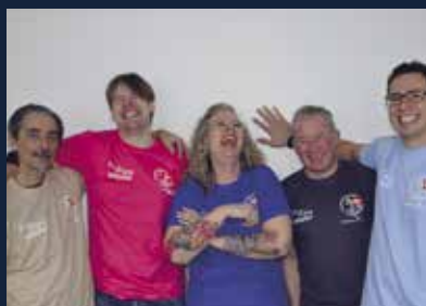
Fit4Sea – året der gik 8