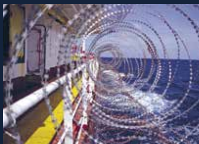
Vigtigt skridt for en international definition af søfarende 11