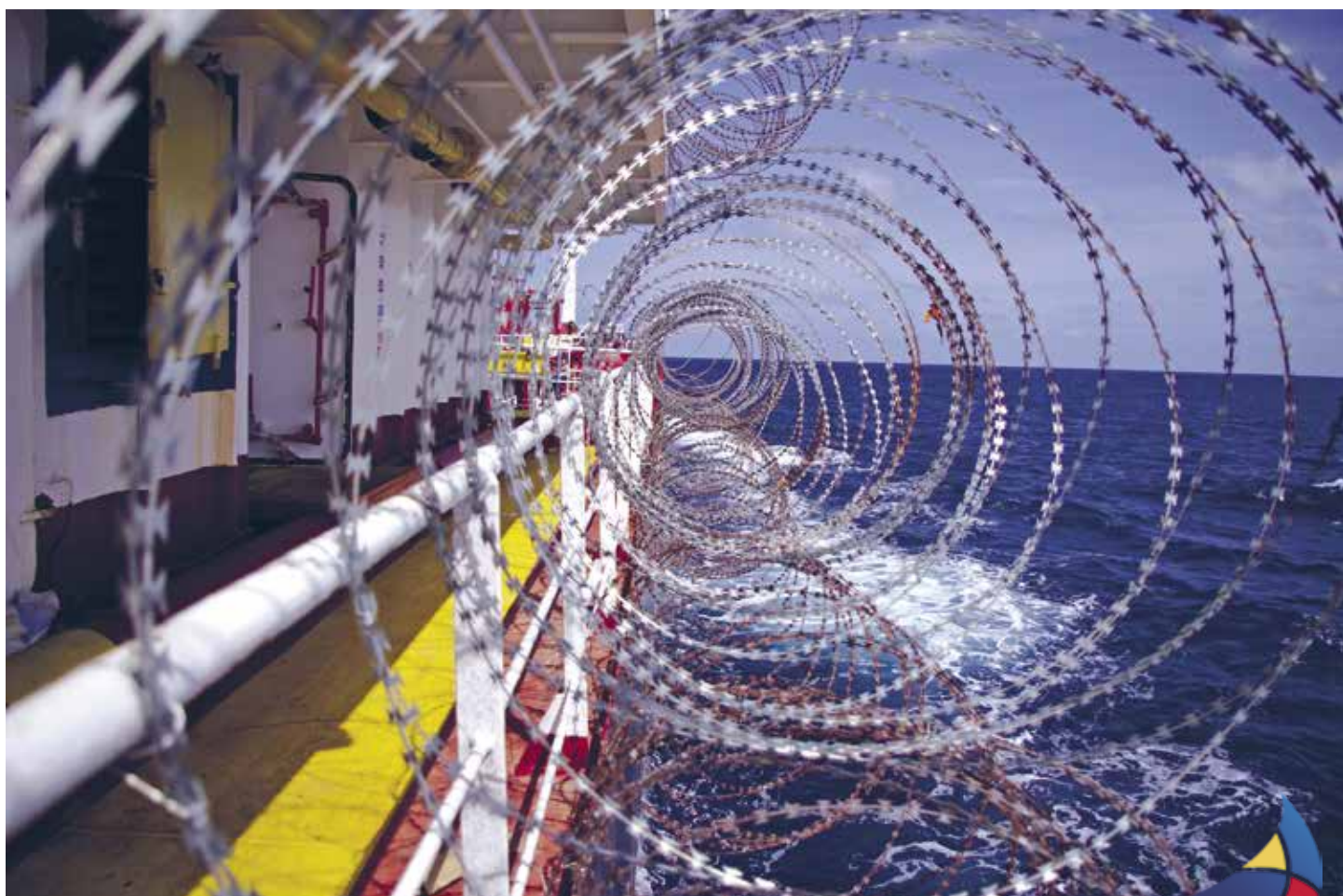
Siden 2015 er der sket en tredobling af kidnapninger til søs.