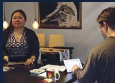
Internettet er nærmest blevet en menneskeret 14

SØFOLKETS 'MUST HAVE' APPS 18 TRÆK STIKKET – TAG I SOMMERHUS 19 "NOGLE GANGE KAN MAN HØRE ET SMIL" 20